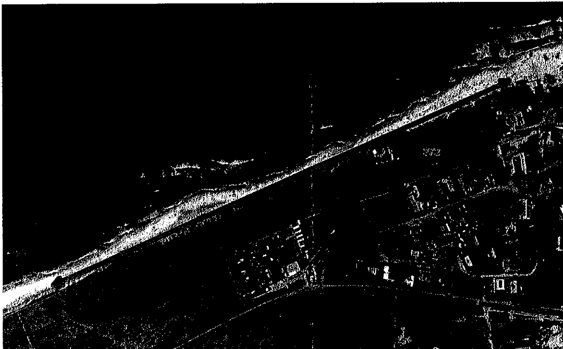
rys. 1 Usytuowanie opaski pod klifem na zachód od bazy rybackiej

W odpowiedzi na pismo BOZ.000-3-5.1.2011.RJ z 09.03.2011 r. w sprawie, jak w nagłówku uprzejmie informuję, że 08 marca br., na przedmiotowym odcinku brzegu rozpoczęły się prace zabezpieczające. W ich zakresie, do 15 czerwca br., pod klifem, od zachodniej granicy bazy rybackiej w Rewalu do km 372,60 (zachodnia granica lasu) wykonana zostanie kamienna opaska narzutowa o długości ok. 800 m.